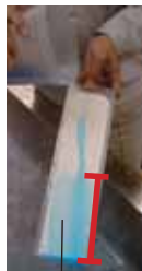
ニッペクリスタコート塗装面