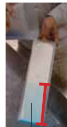
ニッペクリスタコート塗装面

一般水性塗料の塗膜下半分にニッペクリスタコートを塗装し、乾燥後、上から着色水をかけました。(写真左)ニッペクリスタコート塗装面は着色水が濡れ広がり、水と馴染んでいることがわかります。(写真右)