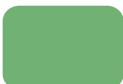
No.21 フレッシュグリーン